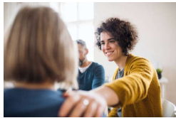
Services d'aide à domicile